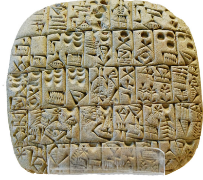
Sümerlerde bir tarla ve eve ait satış sözleşmesi (MÖ 2600)

Görselde yer alan bu kaynak dikkate alındığında Sümerlerle ilgili aşağıdakilerden hangisi söylenemez?