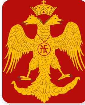
Bizans İmparatorluğu Arması